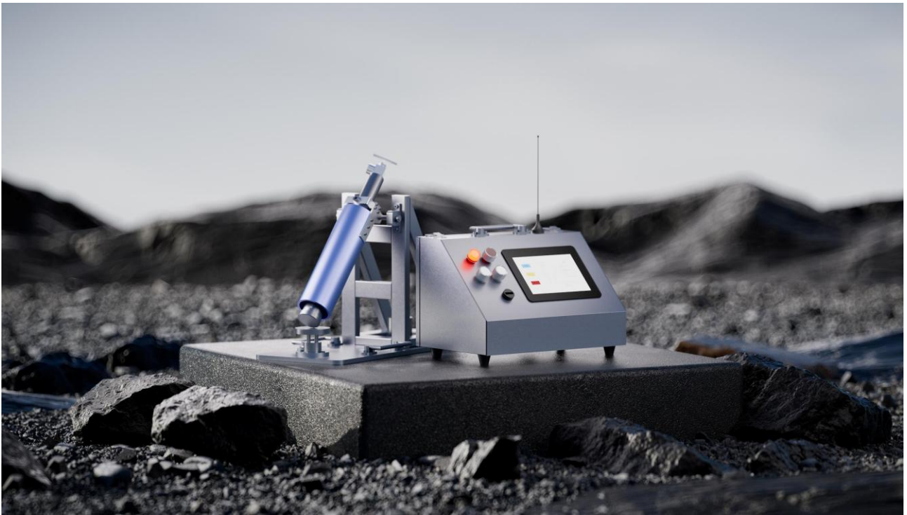
图 1. REALology 高温高压钻完井液静沉降装置